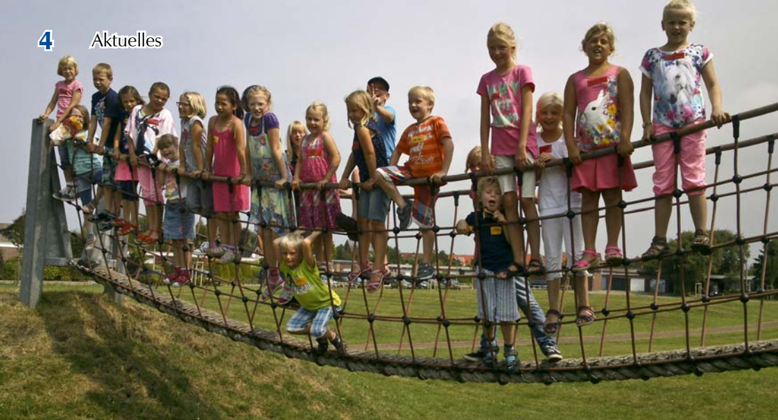
Ausflug zum Kindermusical in Norddeich im Juli.