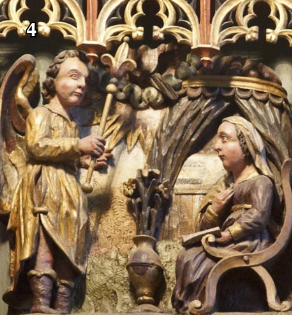
Weihnachten auf dem Funnixer Altar. Oben: Ankündigung der Geburt, unten: Anbetung durch Hirten und Könige.