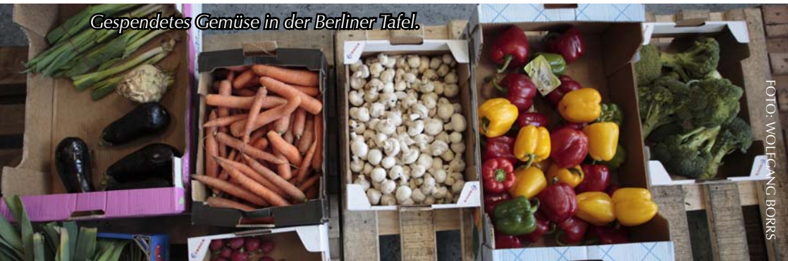
Gespendetes Gemüse in der Berliner Tafel.