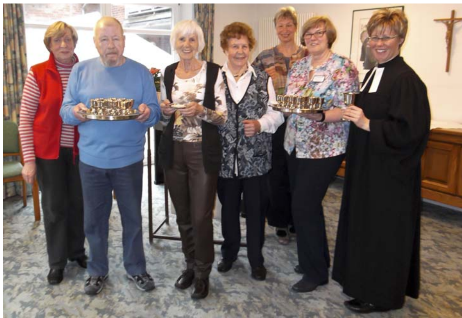
Neues Abendmahlsgeschirr im Carolinum: Für die Abendmahlsfeiern wurden bereits im Frühjahr Einzelkelche angeschafft. Ein Dank den Spendern, die dies mit ermöglicht haben.